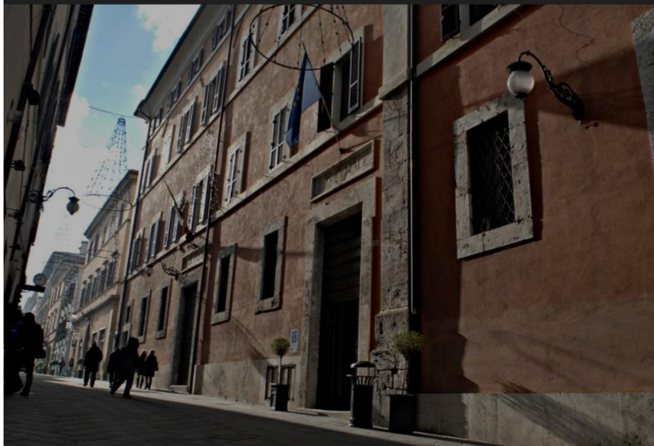
Il tribunale di Spoleto